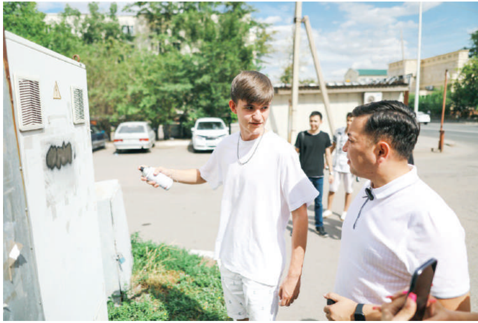
Жыл басынан еліміз бойынша 4000-нан астам есірткі-граффити жойылды.